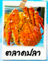
ตลาดมัลลา