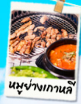
หมูย่างเกาหลี