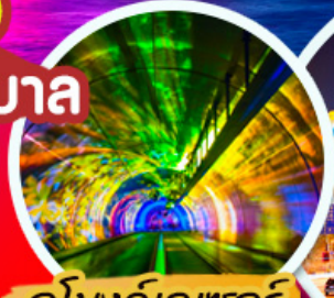
จูโมงค์เลเซอร์