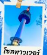
โซลทาวเวอร์