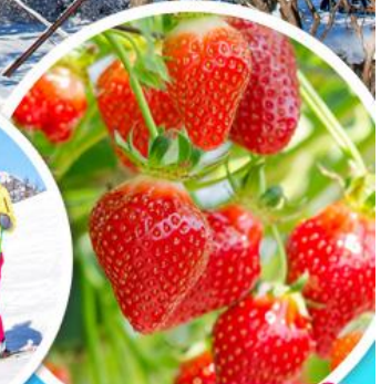
ไร่สตรอว์เบอร์รี่