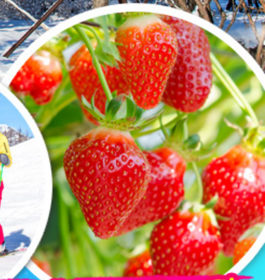
ไร่สตรอว์เบอร์รี่