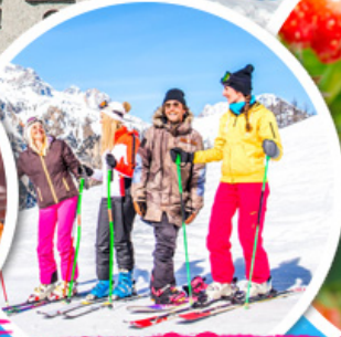
เล่นสกีจุใจ