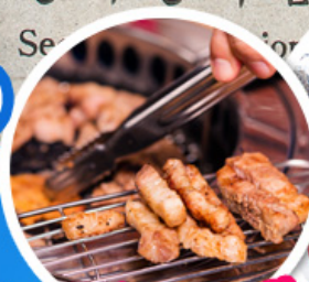
เมนูย่างเกาหลี