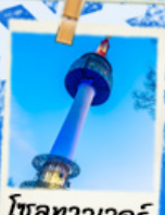
โซลทาวเวอร์