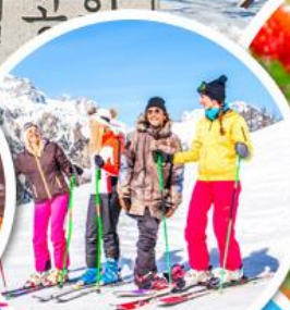
เล่นสกีจุใจ