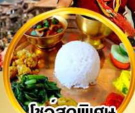
ไขว้สุดพิเศษ ลิ้มรสอาหารเนปาลแท้ๆ

ดินแดนศักดิ์สิทธิ์กลางห้อมกอดหิมาลัย สัมผัสสถาปัตยกรรมอันวิจิตรงดงาม กาฐมันฑู โกดรา ภัคตาปัวร์ บ่าทัน นากากีอิต