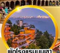
พักโรงแรมบนเขา ชมวิวหิมาลัยสุดฟิน