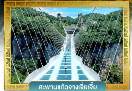
สะพานแก้วจางเจียเจีย

เดินทางโดย: สายการบินเวียดนามแอร์ไลน์ (VZ)