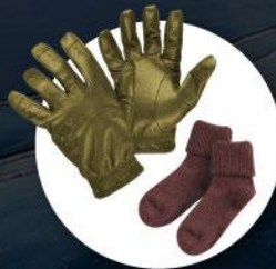
ถุงมือหนาแบบ ถุงเท้ากันหนาวแบบหนา