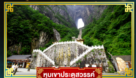
อุทยานประตูสวรรค์