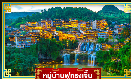
หมู่บ้านฟุหลงเจิน