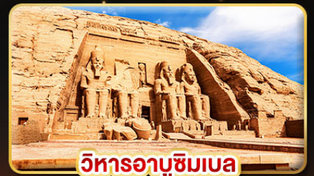
วิหารอาบูซิมเบล

น้ำหนักกระเป๋า 23Kg. (บินระหว่างประเทศ และบินภายใน)