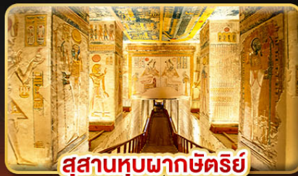
สุสานหุบผากษัตริย์