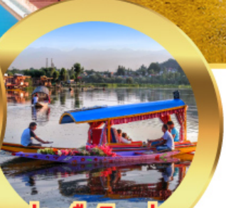
ล่องเรือซิคาร์่า