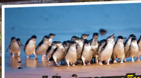
ชมความน่ารักตามธรรมชาติของ พบนเพนกวินพาทรด ณ เกาะฟิลลิป