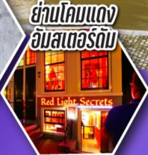
ย่านโคมแดง อัมสเตอร์ดัม

ตะลุยอัมสเตอร์ดัม ทั้งจัตุรัสดามสแควร์ และย่านโคมแดง (Red Light) ราคาเริ่มต้น