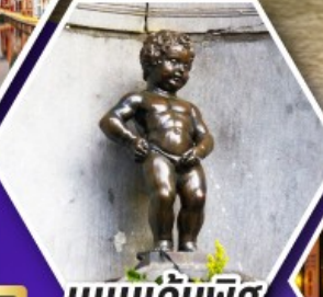
แมมเกินฟิส