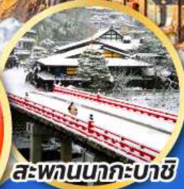
สะพานนากะบาชิ

ชมเมืองแห่งสายน้ำ บรรยากาศย้อนยุค "กุโจะจิมัง"