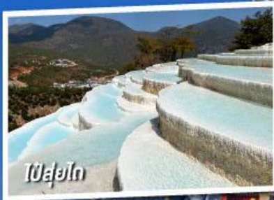
ป๋ายป๋าย

เที่ยวครบทุกไฮไลต์ • ไม่ลงร้านช้อปปิ้ง • พักโรงแรม 4 ดาว