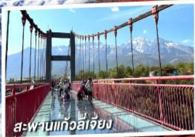
สะพานแก้วลี่เจียง