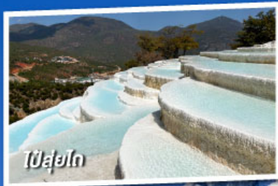
ป๋ายู่โก

เที่ยวครบทุกไฮไลต์ • ไม่ลงร้านช้อปปิ้ง • พักโรงแรม 4 ดาว