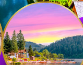
ททิเซ่ ปาดำ