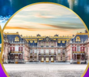
พระราชวังแวร์ซายส์