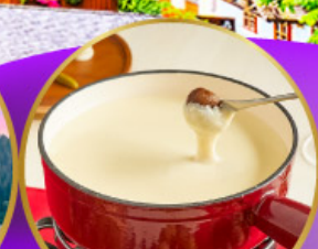
ฟองดูซึส