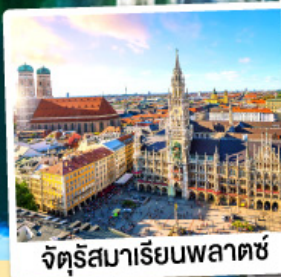
จัตุรัสมาเรียนพลาตซ์