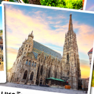
มหาวิหารเซนต์สตีเฟน