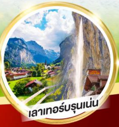
เลาเทอร์บรุนเนน