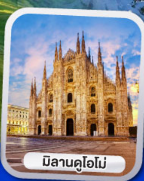
มิลานคูโอโม