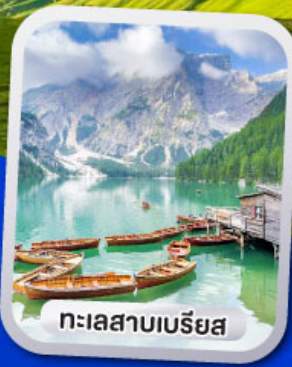
ทะเลสาบเบรียส