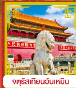
จุดริสเทียนอันเหมิน