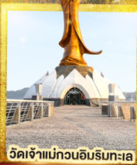
วัดเจ้าแม่กวนอิมริมทะเล