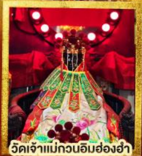
วัดเจ้าแม่กวนอิมฮ่องฮำ