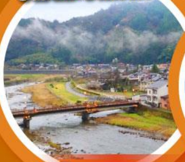
มิซาซาออนเซน

เที่ยวเต็มทุกวันไม่มีฟรีคีย์ ชมเนินทรายทตริที่ใหญ่ที่สุดในญี่ปุ่น ตามรอยกูดน้อย คิตาโร่ และโคมัน นั่งกระเช้าชมวิว 1 ใน 3 ที่สวยที่สุดในญี่ปุ่น “อามาโนะ ฮาชิคาเตะ”