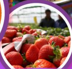
เก็บสตอร์วเบอร์รี่

เดินทาง 04-09, 06-11 ก.พ. 68 14-19, 18-23 ก.พ. 68