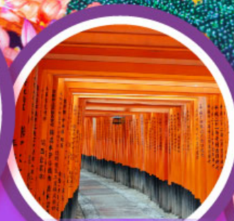
ศาลเจ้าฟูชิมิอินาริ