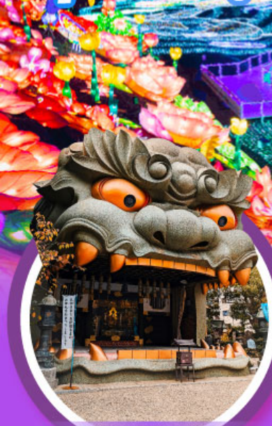
ศาลเจ้านิมบะ ยาชากะ