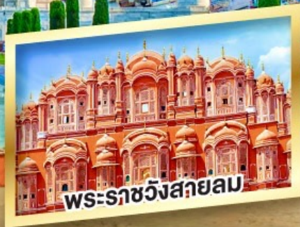
พระราชวังสกายลม