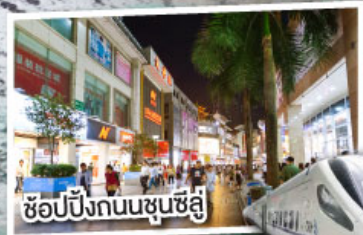
ช้อปปิ้งถนนชุนชี่