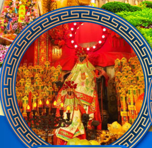
วัดเจ้าแม่กวนอิมสองห้า