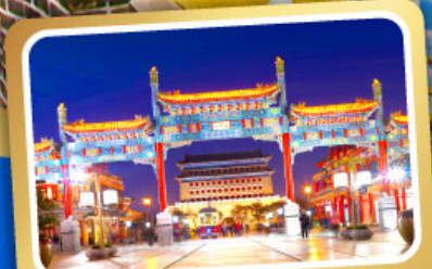
ถนนโบราณเทียนเหมิน