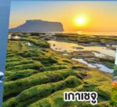
เกาะเชจู