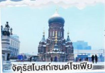
จัตุรัสโบสถ์เซนต์โซเฟีย