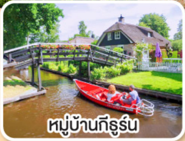
หมู่บ้านทีร์ูร์น