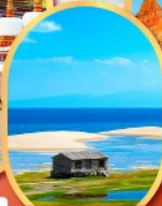
ทะเลสาบชิงไห่