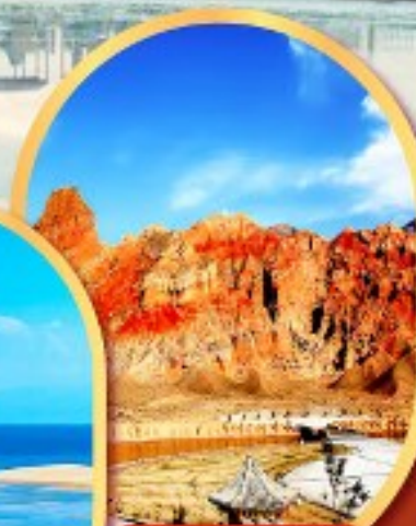
หุบเขาห้าสี อุทยานธรณีกุยเต๋อ