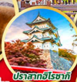
ปราสาทฮิโรซากิ