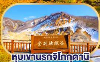
หุบเขานรกจิโกกุคานิ