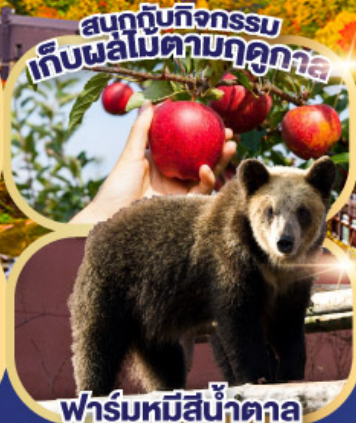
สวนกุหลาบ เก็บผลไม้ตามฤดูกาล