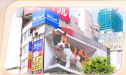
ซ็อบบิงย่านชินจูกุ