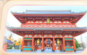
วัดฮาซากุสะ