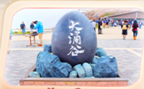
ชุมชนไร่ดำโอวาคุดานิ