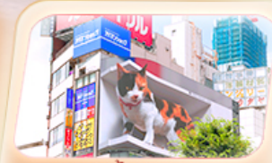
ช้อปปิ้งย่านชินจูกุ