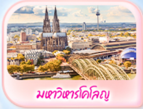
มทาวีฑารโคคิย