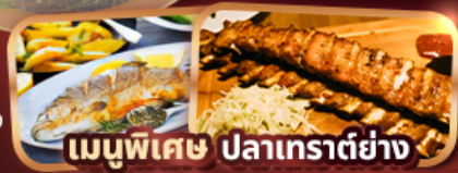
เมนูพิเศษ ปลาเทราต์ย่าง Rib's Of Vienna (1 rack 500g)