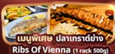
เมนูพิเศษ ปลาเทราต์ย่าง Ribs Of Vienna (1 rack 500g)