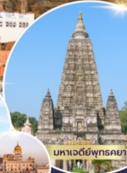
มหาเจดีย์พุทธคยา