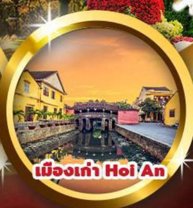
เมืองเก่า Hoi An