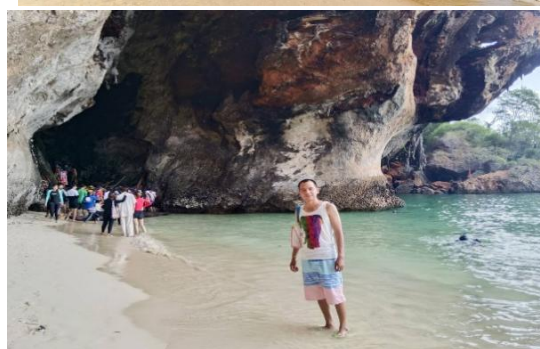
ถ่ายรูปเกาะไก่ ลงเล่นน้ำ เกาะไก่ ชมปะการังหลากสี ปลาการ์ตูน และ ปลานานาชนิด