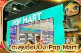
ตะลุยช้อปปิ้ง Pop Mart