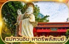
แม่กวนอิม หาดริฟลิสเบย์