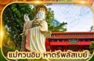
แม่กวนอิม หาดรพีลัสเบย์