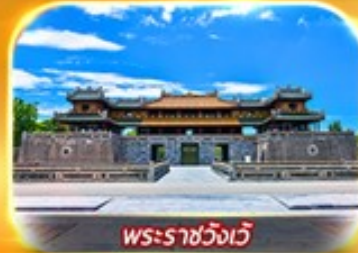
พระราชวังเว้