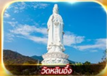
วัดหลินอึ้ง