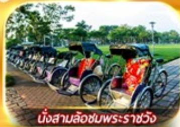
นั่งสามล้อชมพระราชวัง

สัมผัสความสวยงามหมู่บ้านสไตล์ฝรั่งเศสที่บานาฮิลล์ วัดเทียนมู่ พระราชวังเว้ สัมผัสเมืองโบราณฮอยอัน ล่องเรือกระดิง