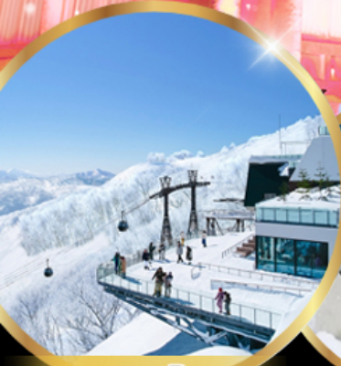
จุดชมวิว Unkai Terrace