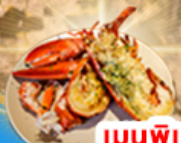
เมนูพิเศษ! "กุ้งล็อบสเตอร์"