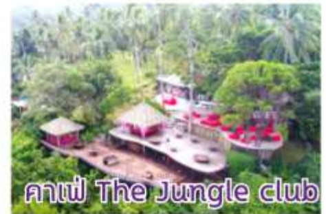
คาเฟ่ The Jungle club

16:30 น. ทุกท่านเตรียมพร้อมกับการขึ้นเรือ เพื่อออกเดินทางต่อ 18:00 น. เรือ Costa Serena อำลาเกาะสมุย มุ่งหน้า กลับสู่แหลมจิ้ง คำ รับประทานอาหารค่ำ และร่วมปาร์ตี้สนุกๆ กับพนักงานเรือเป็นการส่งท้ายก่อนกลับ