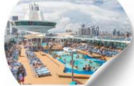
พักผ่อนบนเรือ