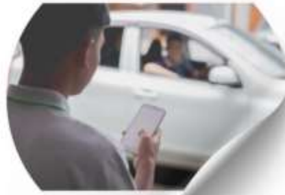
ลงเที่ยวเอง