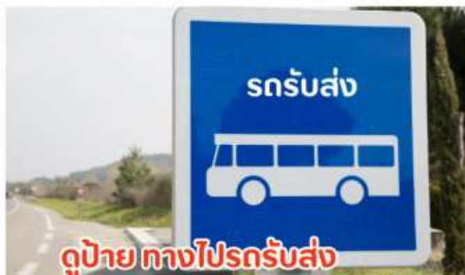
ดูป้าย ทางไปรถรับส่ง