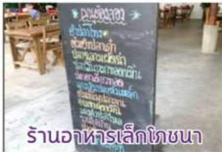
ร้านอาหารเล็กโทชนา