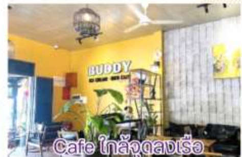
Cafe ไกล่จูดลงเรือ