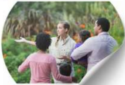
ซื้อทัวร์เสริม