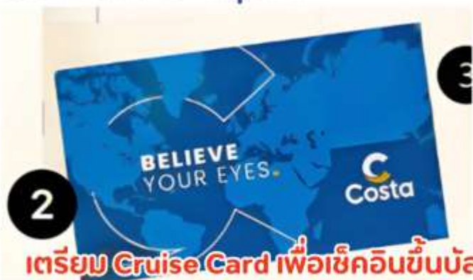
เตรียม Cruise Card เพื่อเช็คอินขึ้นบัส