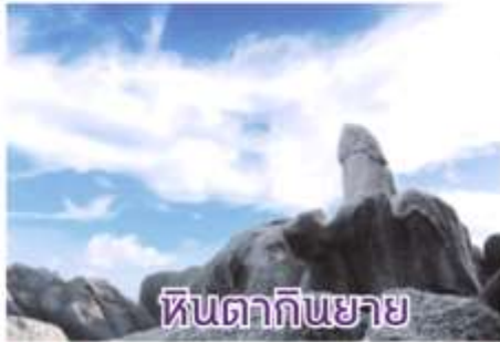
หินตากินยาย