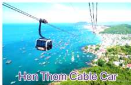
Hon Thom Cable Car