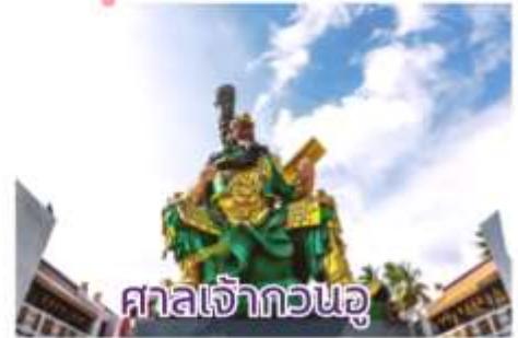
ศาลเจ้ากวนอู