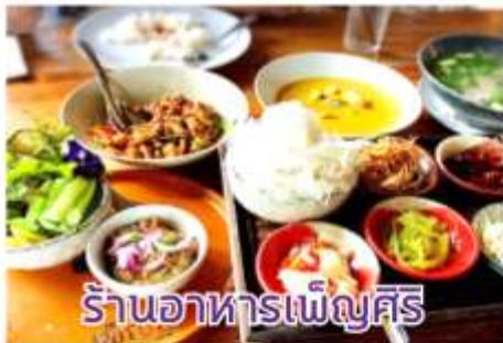
ร้านอาหารเพ็ญศรี