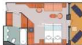
Floor Diagram Suite Sleeps up to: 3 42 Cabins Cabin: 337 sqft (32 m 2 ) * Size may vary, see details below.