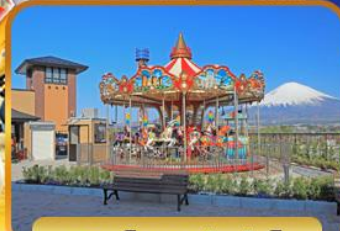
โกเก็มบะเจ้าท่เล็ด