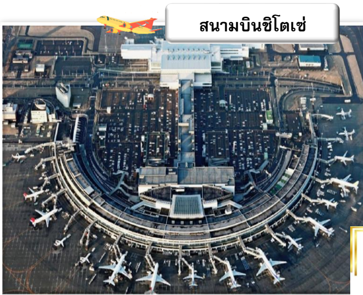
สนามบินซีโตเซ่

เวลา 02.05 น. ออกเดินทางสู่ สนามบินซีโตเซ่ ประเทศญี่ปุ่น โดยสายการบินไทยแอร์เอเชียเอ็กซ์ เที่ยวบินที่ XJ 620