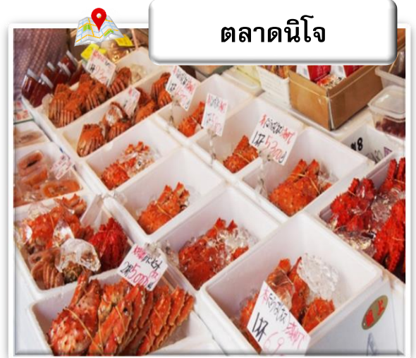
ตลาดนิโจ

ตลาดนิโจ มีประวัติศาสตร์ยาวนานกว่า 100 ปี เปรียบเสมือนห้องครัวของชาวเมืองซัปโปโรมาตั้งแต่สมัยก่อน นอกจากปลาแซลมอน ปู และหอยเชลล์ที่เป็นอาหารทะเลเด่น ๆ ของฮอกไกโดแล้ว ยังเต็มไปด้วยผลผลิตทางการเกษตรอย่างผลไม้และผักนานาชนิด นับเป็นตลาดที่ขาดไม่ได้สำหรับชาวเมืองซัปโปโรเลยทีเดียว ที่ตลาดนิโจในปัจจุบัน นอกจากจะมีร้านที่เปิดกิจการต่อเนื่องมาหลายสิบปี ก็ยังมีร้านที่เพิ่งเปิดใหม่ และบริเวณรอบ ๆ ก็มีร้านอิซากายะ (ร้านเหล้า) และร้านอาหารที่มีเอกลักษณ์เฉพาะตัวเพิ่มมากขึ้น ที่นี่จึงกลายเป็นสถานที่ท่องเที่ยวยอดนิยมที่สามารถมาทานอาหารทะเลสด ๆ ก็ได้ มาเลือกซื้อของฝากก็ได้