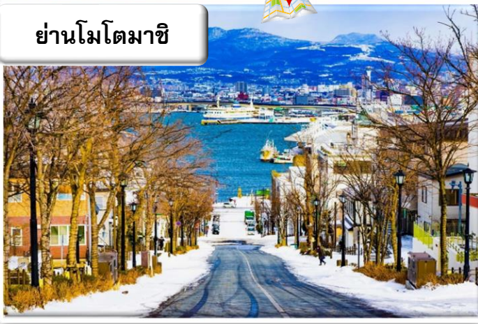
ย่านโมโตมาชิ

ย่านเมืองเก่าโมโตมาชิ (Motomachi District) หรือมีชื่อเรียกอีกอย่างว่า ท่าเรือเมืองฮาโกดาเตะ ตั้งอยู่ที่เมืองฮาโกดาเตะ (Hakodate) ภายในจังหวัดฮอกไกโด (Hokkaido) ย่านนี้นับเป็นย่านที่มีประวัติยาวนานเป็นร้อยปี แลumlสิ่งปลูกสร้างต่างๆก็ยังคงมีการอนุรักษ์ไว้อย่างดีเยี่ยม แม้ภายหลังจะมีบ้างแห่งที่มีการปรับเปลี่ยนเป็นอย่างอื่นบ้าง หากด้านนอกก็ยังคงรักษาสถาปัตยกรรมแบบดั้งเดิมไว้อย่างดีงาม