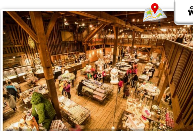
พิพิธภัณฑ์กล่องดนตรีโอตารุและหอนาฬิกาไอน้ำ

คลองโอตารุ (Otaru Canal) หรือในภาษาญี่ปุ่นเรียกว่า โอตารุอุงกะ (Otaru Unga) เป็นคลองที่มีความสวยงามซึ่งไหลผ่านกลางเมืองโอตารุ เป็นแหล่งดึงดูดนักท่องเที่ยวที่สำคัญของเมืองในทุกฤดูกาล สามารถเดินเล่นริมคลองและมีบริการล่องเรือในคลองอีกด้วย ส่วนบริเวณริมคลองตกแต่งด้วยคอมไฟส์สไตล์วิคตอเรียนและมีอาคารโกดังที่สร้างจากอิฐเป็นแนวยาวไปตามคลอง ซึ่งในสมัยก่อนใช้เป็นโกดังสินค้าและในปัจจุบันได้กลายมาเป็นร้านอาหาร ทำให้ได้บรรยากาศโรแมนติกมาก ๆ ในช่วงเดือนกุมภาพันธ์ของทุกปียังใช้เป็นหนึ่งในสถานที่จัดงานเทศกาลหิมะช่วงหน้าหนาวซึ่งจะมีการประดับตกแต่งด้วยคอมไฟท์ในเมือง