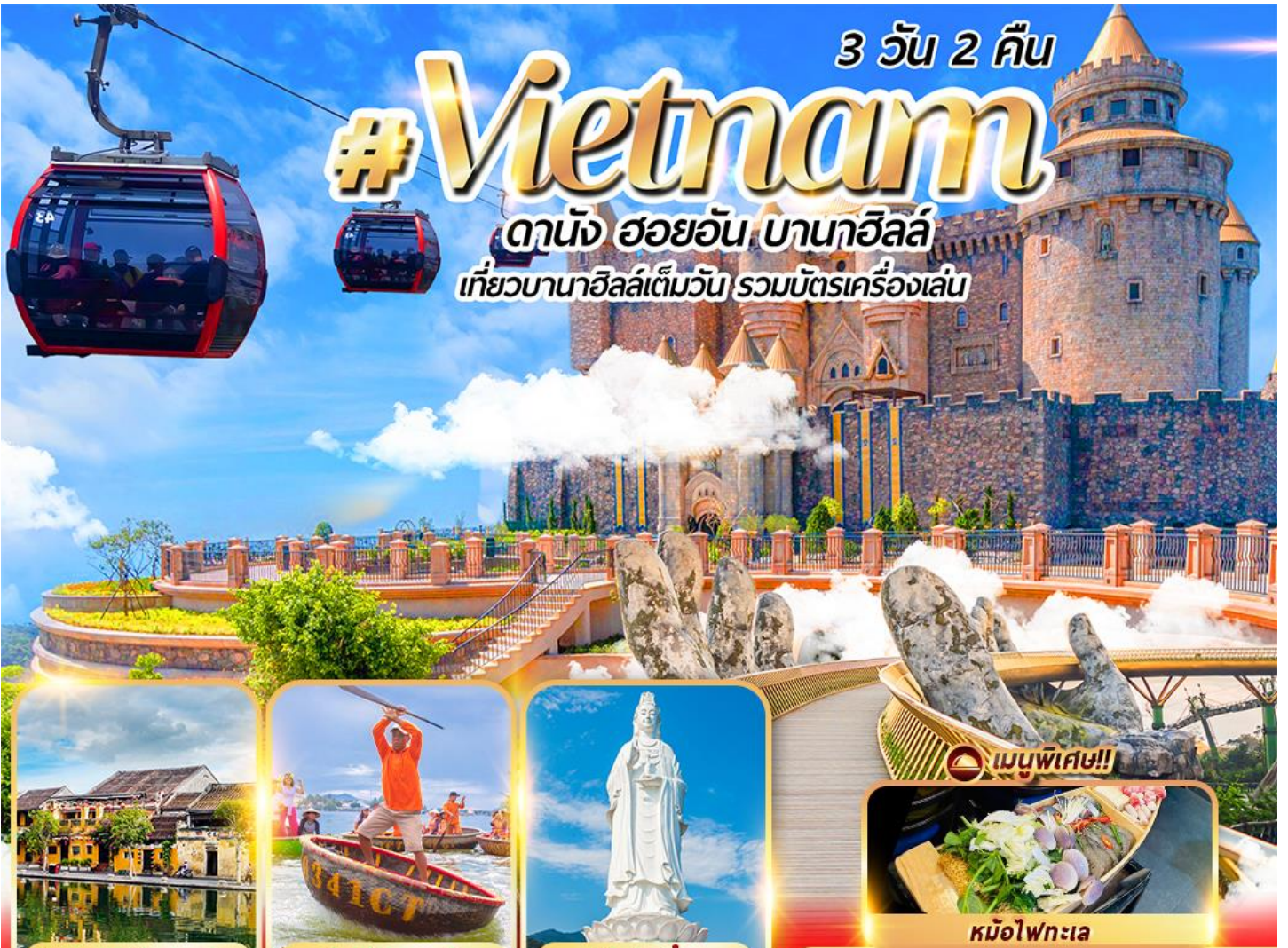
เมืองมรดกโลกฮอยอัน

ดานัง ฮอยอัน บานาวิลล์ เที่ยวบานาวิลล์เต็มวัน รวมบัตรเครื่องเล่น