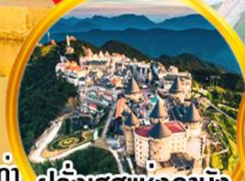
ฝรั่งเศสแห่งดานัง