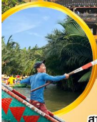
นั่งเรือกระด้ง