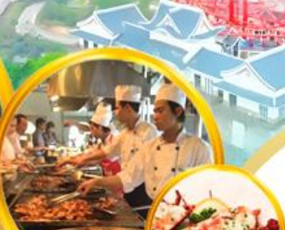
บุฟเฟ่ต์นานาชาติ