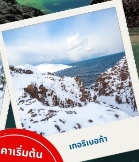
เทอริเบอก้า