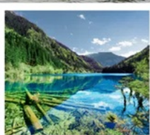
จั๋วจ้ายโกว

จาก 8 ชม. เหลือ 2 ชม. เร็วทันใจด้วยรถไฟความเร็วสูง เฉิงตู - จั๋วจ้ายโกว