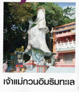
เจ้าแม่กวนอิมริมทะเล