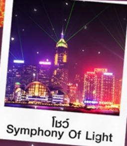
โชว์ Symphony Of Light