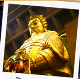
วัดเขากงหมิว