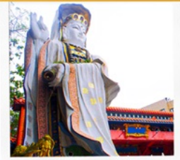
เจ้าแม่กวนอิม